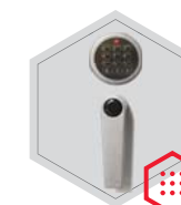
Elektronisches Schloss Stellar Business