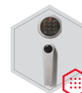
Elektronisches Schloss Stellar Basic