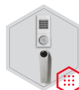
Elektronisches Schloss B 90