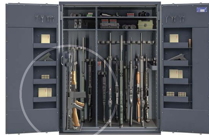
SCHWENKWAND FÜR 5 STÜCK WAFFEN