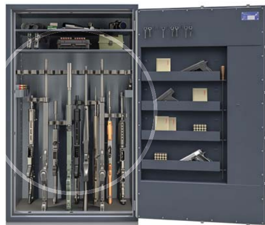
VERSTELLBARE WAFFENHALTER auf schienen und magneten