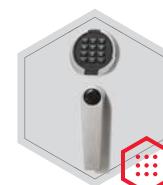
Elektronisches Schloss Primor 3000 level 15